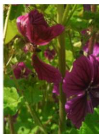
Abeille sur mauve sylvestre