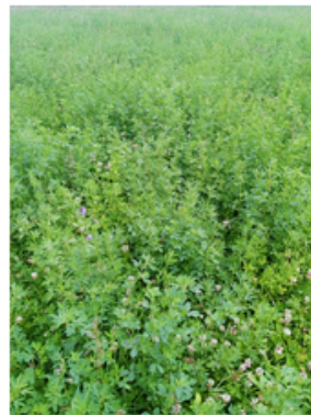
"Ça grouille de butineurs !"